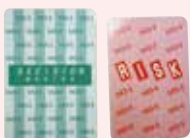
意思決定カード・ リスクカード