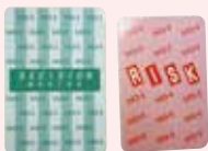
意思決定カード・ リスクカード